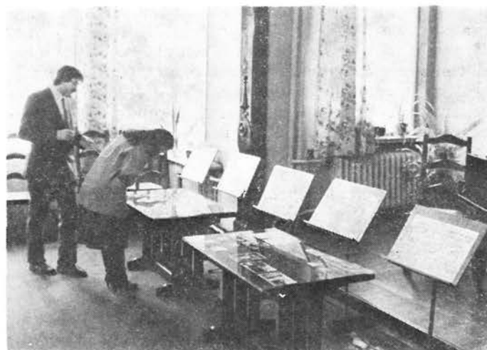
Uczestnicy Walnego Zgromadzenia mogli zwiedzać wystawę dotyczącą działalności TiFL...